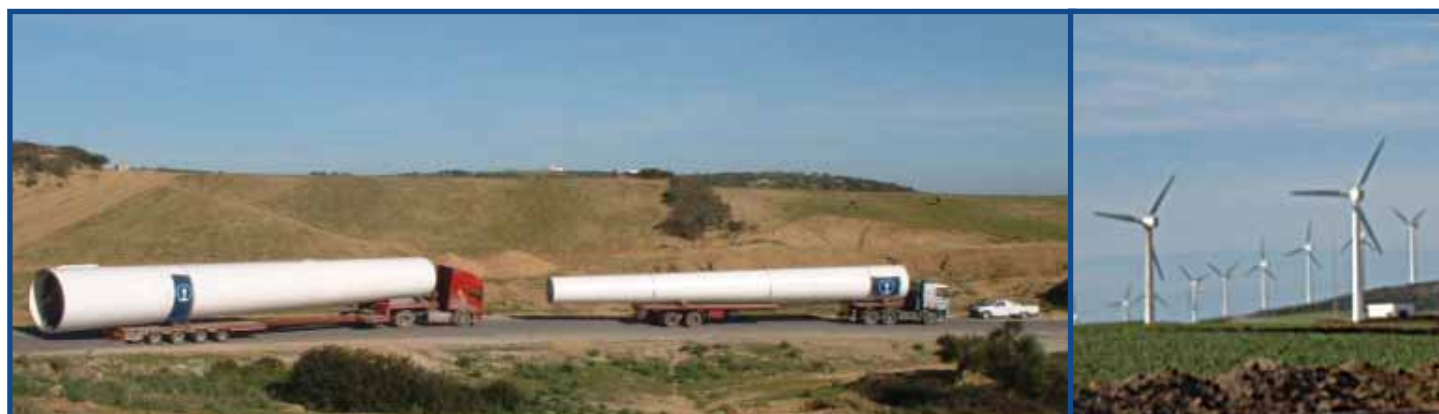
Projet de l'extention de la centrale éolienne de la STEG à Sidi Daoued Project of extension of the STEG wind power station in Sidi Daoued