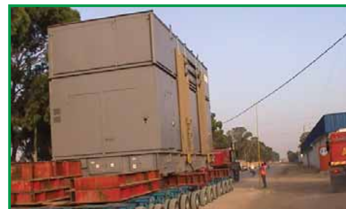
Projet turbine à gaz à Thyna (Sfax) GENERAL ELECTRIC pour la STEG Gas turbine project in Thyna (Sfax) STEG power station