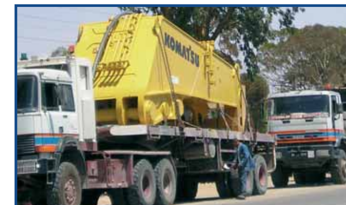
Transport d'un tractopelle depuis le port de Radès jusqu'à Gafsa Transport of a tractor loader from Rades port to Gafsa